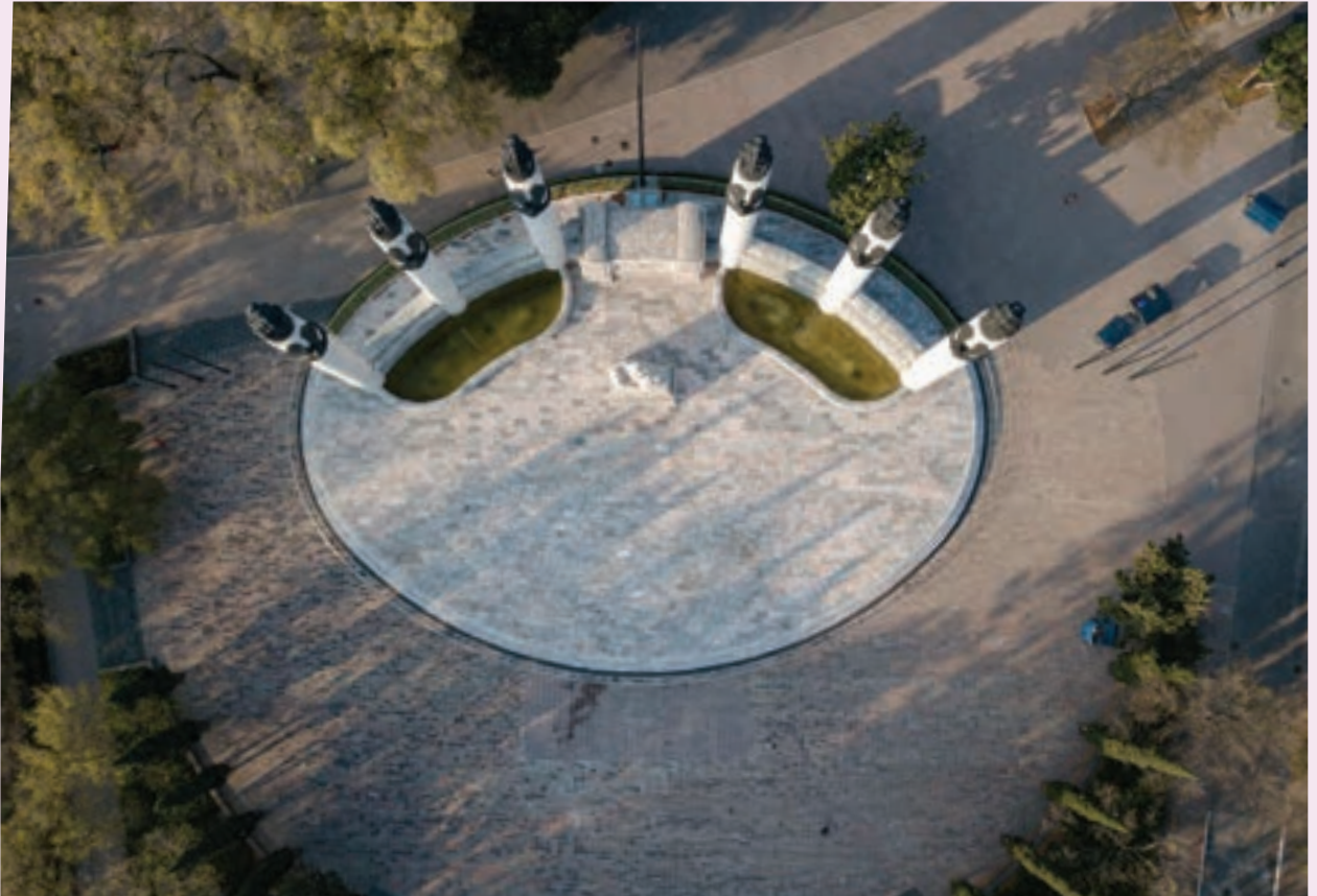
vii Guillermo Keller López, Altar a la Patria "Monumento a los Niños Héroes" , Ciudad de México, 2020.